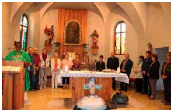
Angelobung des PGR-Neuhaus/Klb., am 3. September 2017, neu gewählt am 19. März 2017 für die kommenden fünf Jahre.